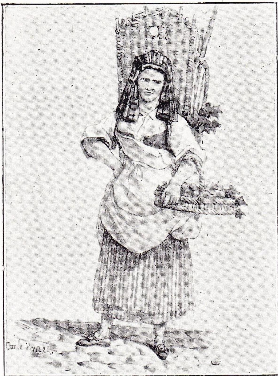
LES PETITS MÉTIERS DE PARIS. Marchande de quatre-fleurs. D'après l'original de CARLE VERNET. (Bibliothèque de la Ville de Paris.)